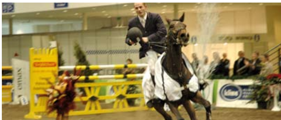
Runda Zwycięzców The Champion Round

It all started back in 1993 in an indoor arena in Racot, where the 1 st Polish Indoor Jumping Championships for Seniors took place. In 1994, the competition organised by "Abaria" Iwno Horse Riding Club was moved to the grounds of the Poznań International Fair. Foreign participants were present at the 2 nd Polish Indoor Championships for Seniors for the first time. As the Secretary General of the Polish Equestrian Federation said at that time: "The impossible became real. The event was held not in a horse-riding arena, but in a facility that serves a different function (...). It was a truly European event for the first time". The 3 rd Polish Indoor Championships and CSI-B were held in 1994. The Polish Dressage Championships were organised