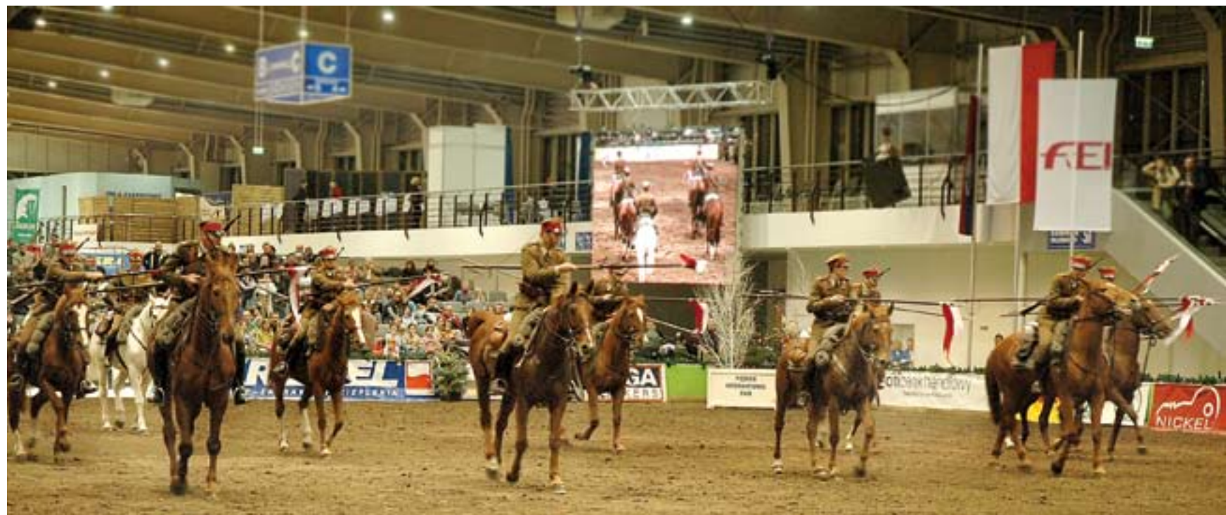
Parada Musztry Ułańskiej The Uhlan Drill Show